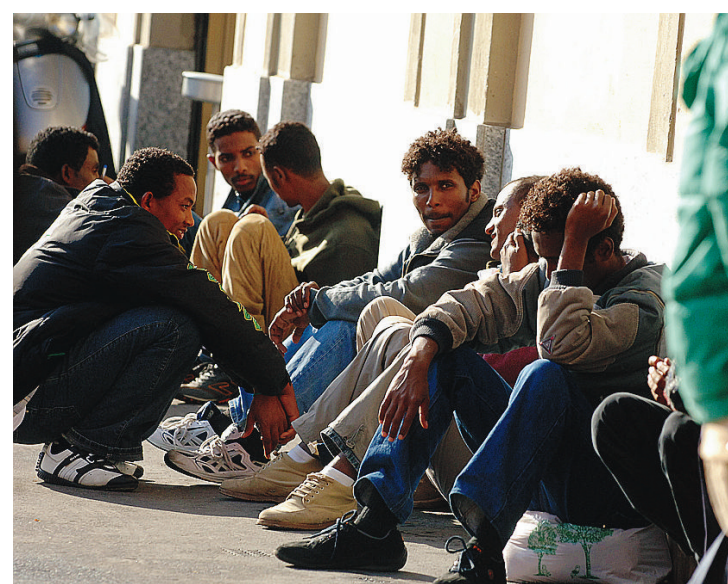
EXTRACOMUNITARI Il centro di accoglienza a Rho non si farà più

fatti deciso che la palazzina in costruzione in via Magenta 2, non verrà più destina-