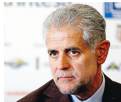
GOVERNATORE Roberto Formigoni